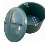
šachta na dmychadlo