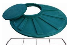
příplatkové pochozí víko