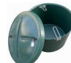
šachta na dmychadlo